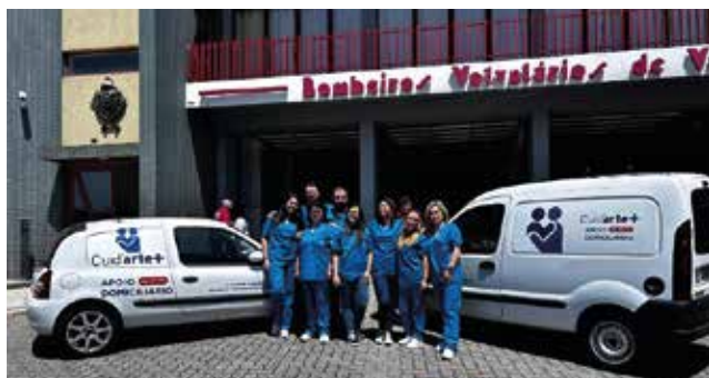
A nossa equipa Cuid' arte +