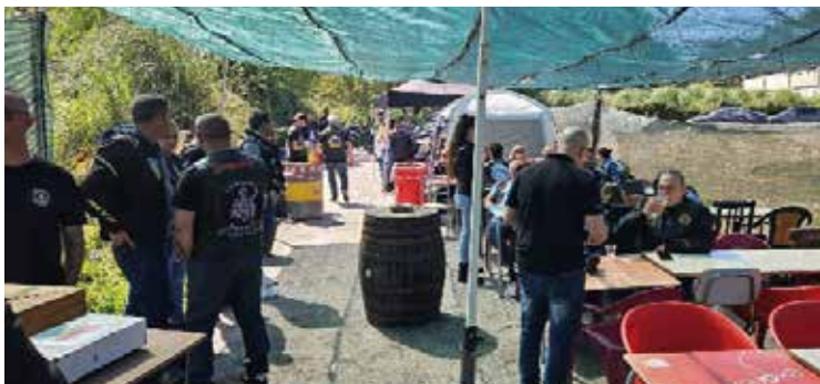
Reabertura da sede dos Motard's de Valadares