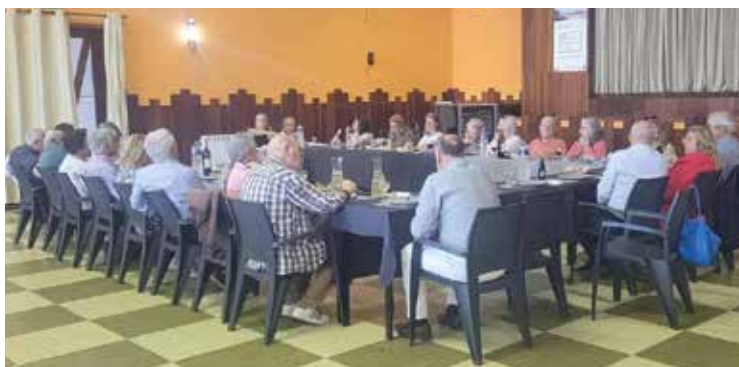
Almoço do Orfeão de Valadares